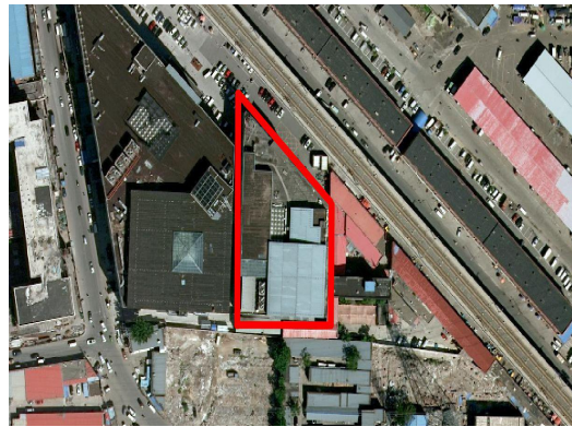
图 4 事发建筑空间影像图

2012年6月14日，方保安注册成立了北京大方万恒茶叶市场有限公司。经查，方保安注册成立该公司提供的企业住所（经营场所）证明由十八里店乡政府、十里河村民委员会加盖公章并签字，为其证明经营场所建设审批手续齐全、不属于违法建设，朝阳区市场监管部门为其发放了营业执照。此后，在该建筑内注册的其他公司均以十八里店乡政府提供的经营场所消防审核、消防意见和消防安全证件齐全、属于合法的商业设施证明，以及大方万恒公司出具的“不是违法建设”等证明材料为其他公司办理了营业执照。2020年12月3日，北京大方万恒茶叶市场有限公司变更为大方万恒公司。