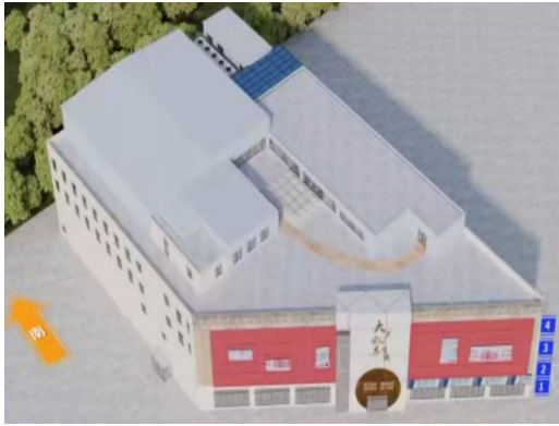
图 3 事发建筑示意图