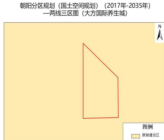
图 2 两线三区图