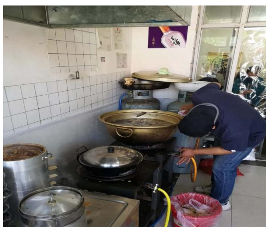
事发前燃气设施连接情况

气钢瓶，由王某某于5月9日配送，直接放置于操作区南侧靠墙处，其中，1个钢瓶（河北百工）通过调压器、橡胶软管直接与一台单眼灶具连接，另外1个钢瓶（山东环日）通过调压器、连接橡胶软管后再通过三通阀分成两条支管（使用卡箍固定），分别连接到蒸煮炉和另一台单眼灶具上。