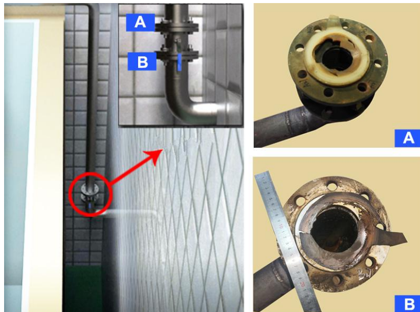
图3 燃气管道主阀门及法兰垫片图

经检测，A、B两个法兰垫片材质为甲基乙基硅橡胶，均检测到残留的二甲醚成分且与气体直接接触的部位二甲醚含量更高。试验发现，垫片材质不耐液化石油气腐蚀，添加二甲醚会加速腐蚀进程，导致垫片物理机械性能显著下降。